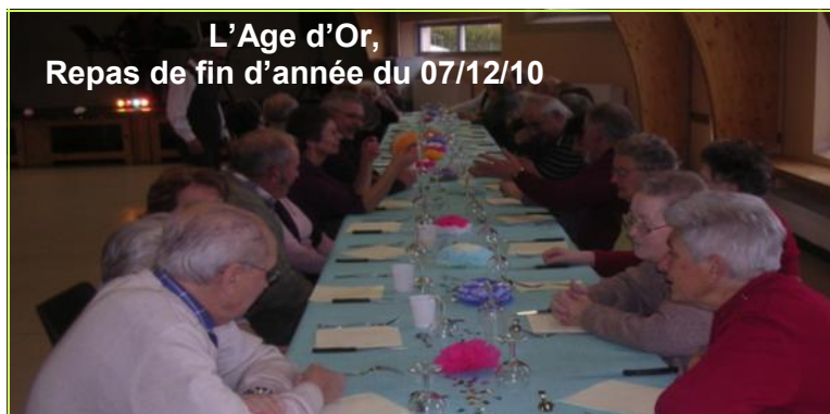
L'Age d'Or, Repas de fin d'année du 07/12/10

Une animation « Bébés-lecteurs » est assurée tous les vendredis de 10 à 11 h.