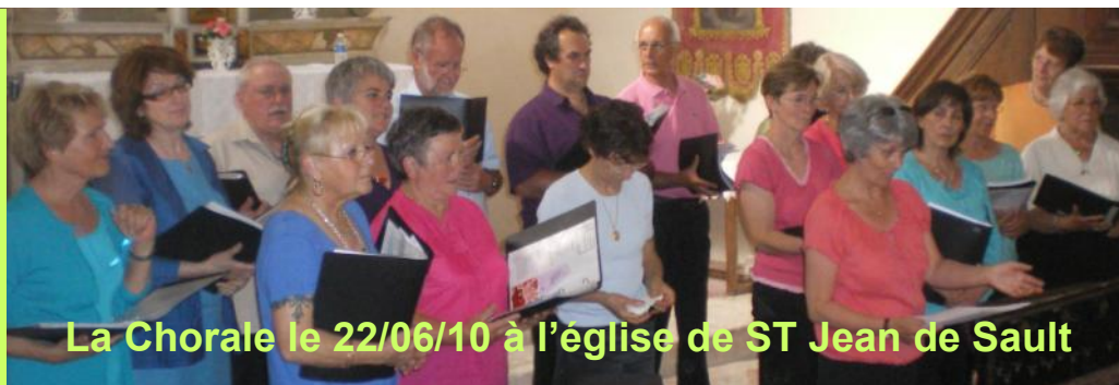
La Chorale le 22/06/10 à l'église de ST Jean de Sault