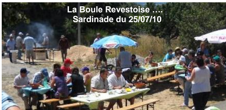
La Boule Revestoise .... Sardinade du 25/07/10